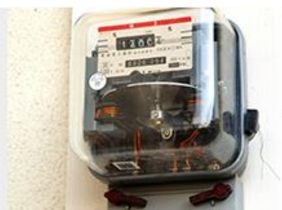
従来の電気メーター

※スマートメーターへの交換には、原則費用はかかりません。（ただし、メーター交換に伴う工事に費用がかかる場合があります。）また、交換時には停電（目安：1軒あたり約15分）が伴う場合があります。