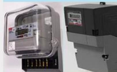
ユニット式 一体型 スマートメーター